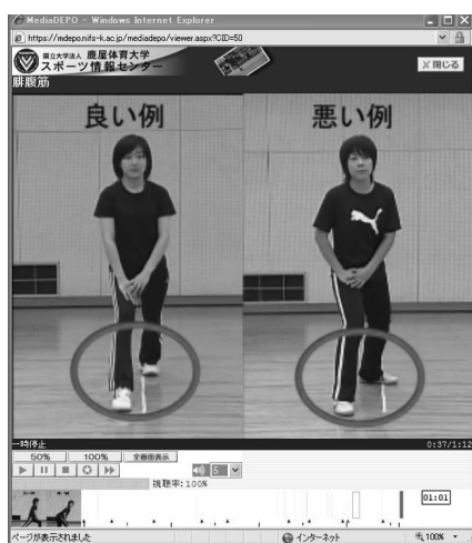
図2 エアロビックダンスコンテンツ(P)

Internship コンテンツは、「実習マナー」「安全管理」「救命処置」から構成されており、実習に際して確認しておきたい事項についての学習教材である (図3)。