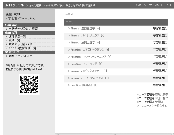
図4 TPI コンテンツ一覧

現在では、これらの学習用コンテンツは、全て鹿屋体育大学の e-Learning システムに収録されており、実習生をはじめ誰でもが利用可能な状態で学内に提供されている (図4)。