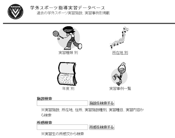
図8 実習データベース 検索画面

データベースは、実習種類（民間体育施設、公共体育施設など）、実習先所在地、年度、キーワードなどから検索可能で、実習先に関する情報（住所、電話、URLなど）、指導したスポーツ種目、実習の内容、指導の対象者（青少年、高齢者、疾病者など）、過去の実習人数、実習生の所感文などが登録されている。2008年度末現時点では、過去8年分800件のデータが収められている。