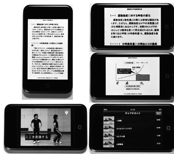
図10 iPod に搭載されたコンテンツ

2008年度にはスポーツ指導実習を行う61名の学生に、約半年間、TPI コンテンツ搭載の iPod touch の貸出を行った。