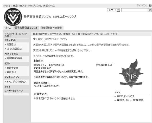
図9 電子実習日誌サイト

今回我々は、グループウェアと呼ばれる共同作業用のシステムを使用して、日誌の電子化を行った(図9)。これを我々は電子実習日誌と呼んでいる。電子実習日誌の利用者は主に実習生と実習先の指導者となることから、簡便かつ容易に利用できることを第1の設計目標とした。そこで今回、実習日誌そのものの作成・編集には、現段階で最も広く利用されているソフトウェアの一つであるMicrosoft Wordを使用することとし、Wordで作成された実習日誌をインターネット上で共有できる仕組みを構築した 8) 。