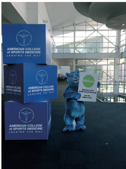
学会会場内(コンベンションセンター)の様子

筆者は、現地時間6月2日の午前に開催されたポスターセッションにおいて、「Relation Between Inspiratory Muscle Strength and Recruitment Onset of Neck Inspiratory Muscles」という研究題目にて発表を行った。その内容は、吸気に関わる因子である Flow rate ( L \cdot s^{-1} ) と肺気量 (L) を厳密に規定した条件下で算出された胸鎖乳突筋と斜角筋の活動開始の指標と吸気筋力の指標である最大吸気圧との関係および吸気抵抗単体の因子が胸鎖乳突筋と斜角筋の活動開始の指標に与える影響を検討したものである。その結果、「吸気筋力が低いヒトほど、また、吸気抵抗が大きい方が、胸鎖乳突筋と斜角筋の活動開始は早まる」ことが明らかとなった。これらの結果は、吸気抵抗が大きい場合または、吸気筋力が低いヒトは、胸鎖乳突筋と斜角筋が活動しやすいことを示している。胸鎖乳突筋と斜角筋の筋活動量と呼吸困難感には有意な正の相関があることから、この応用先として、吸気筋トレーニングを行い、最大吸気圧を向上させることで、胸鎖乳突筋と斜角筋の活動開始は遅延し、その結果、呼吸困難感の緩和につながるといえ、本研究は、呼吸困難感と闘う呼吸器疾患患者や持久系アスリートにとって有益な情報となり得ることが示唆された。また、最大吸気圧という吸気